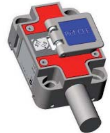
Serrure à pêne 15 mm Réf. : NXOP 15

Sécurité positive : Ouverture du circuit par arrachement de contact lié à la manoeuvre de la clé.