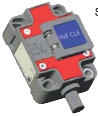
Serrure à pêne 10 mm Réf. : NXOP 10