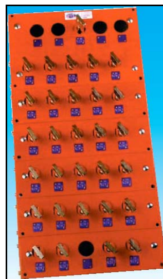
TMEC 30 E A/29XB